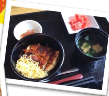
メニュー考案 管理栄養士より☆