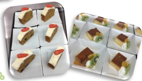
お楽しみ♪ 手作りおやつ