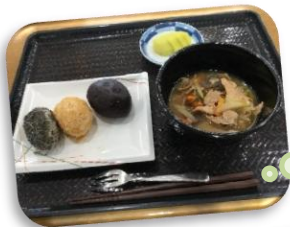
春分の日ランチ 手作りぼたもち